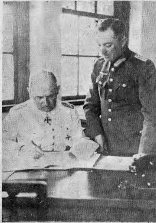
EL MARISCAL LIST Comandante en jefe de las fuerzas alemanas en los Balcanes y ahora jefe del ejército alemán en Rusia en su Cuartel General el día de la capitulación del Ejército Griego. Junto a él se halla el jefe de comando de las fuerzas de Sudoeste.

COMUNICADO DEL CUARTEL GENERAL DE HITLER CUARTEL GENERAL DEL FUHRER, 2 UP. — El estado mayor alemán dió a publicidad el siguiente comunicado: —(PASA a la Pág. 3, Col. 7)